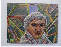
Bács Emese: Egy nő Budapesten (2015, olaj, kollázs, farost)